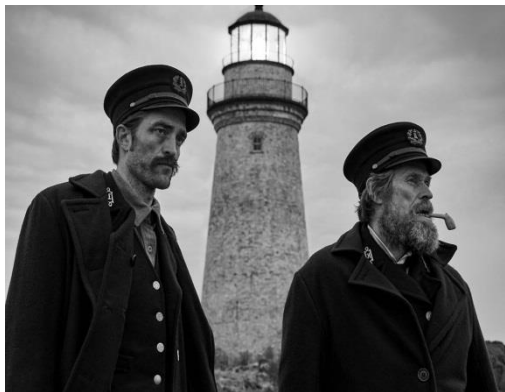
Imagen película "El faro"

En retrospectiva, lo que inicialmente parecía un obstáculo insuperable se convirtió en una oportunidad de crecimiento personal y profesional. Mi habilidad para desenvolverse en las IAs y para diseñar páginas web no solo mejoró, sino que también adquirí un conjunto de habilidades digitales valiosas que son cada vez más demandadas en el mundo actual. Experimenté una sensación de logro y satisfacción que nunca habría imaginado al principio de mi trayecto y en el que por supuesto quiero seguir investigando y avanzando.