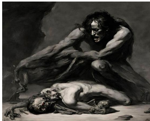
Ilustración por medio de IA