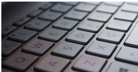
Fotografía del teclado de un ordenador