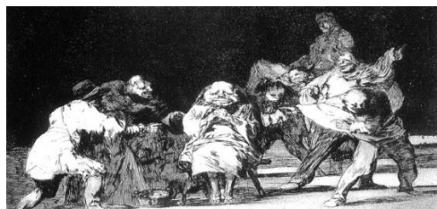
Grabado de Goya