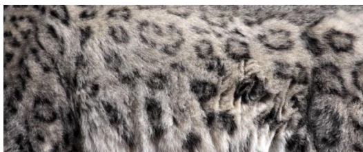
Diseño patrón de piel de leopardo de las nieves